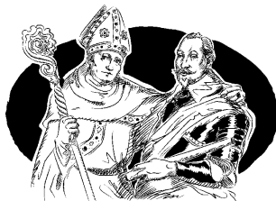
H. Bonifatius & Eusebius